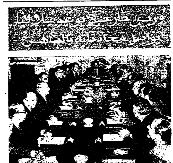
استقبل السيد ممدوح سالم نائب رئيس الوزراء وزير الداخلية المصري امس فيليبس مينشني نائب رئيس الوزراء الخارجية يونغاسيا . وكان مينشني قد وصل الى القاهرة يوم الجمعة الماضي ، في زيارة تستغرق ثلاثة ايام . واجرى محادثات مع السيد اسماعيل نهدي وزير الخارجية المصري كما يبدو في الصورة اعلاه .

تعين السوي مديرا للامن العام بالسعودية تعيين السيد السوي مديرا للامن العام بالسعودية .